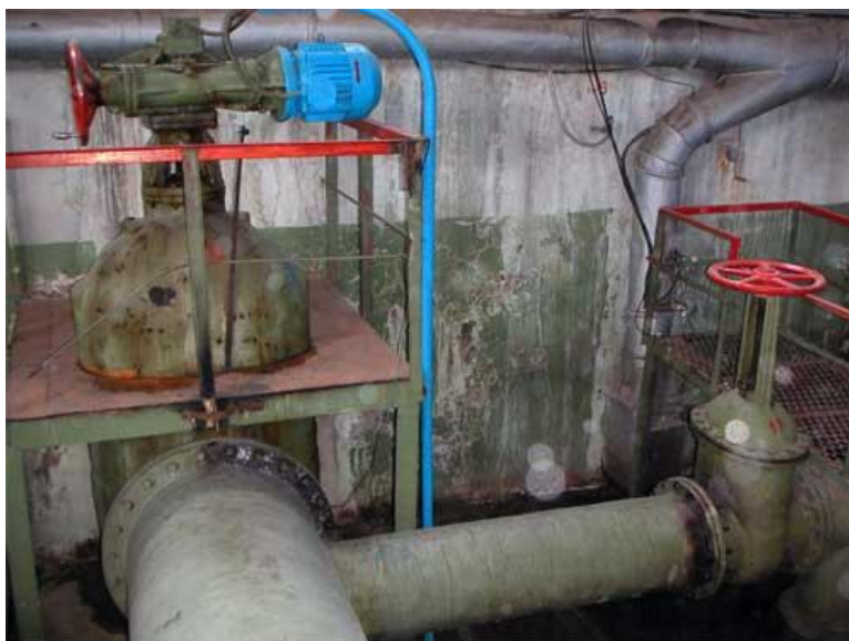
До проведения работ