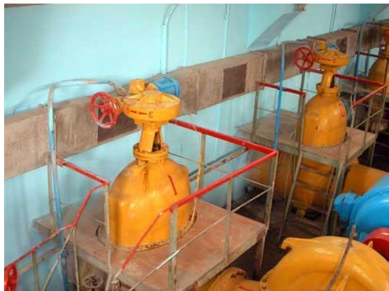
После проведения работ