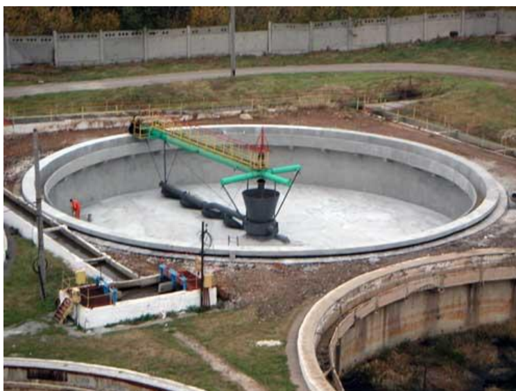
После проведения работ