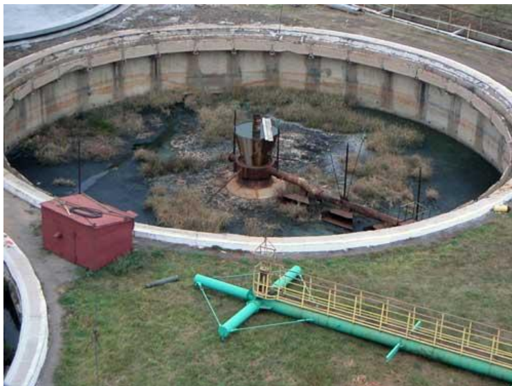
До проведения работ